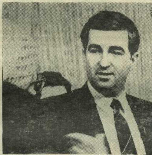
Народный депутат РСФСР А. КОТЕНКОВ:

Итак, будущее России — на переломе. Либо наша республика будет суверенным государством, либо ее растворит небывалый до сих пор конгломерат — СССР.