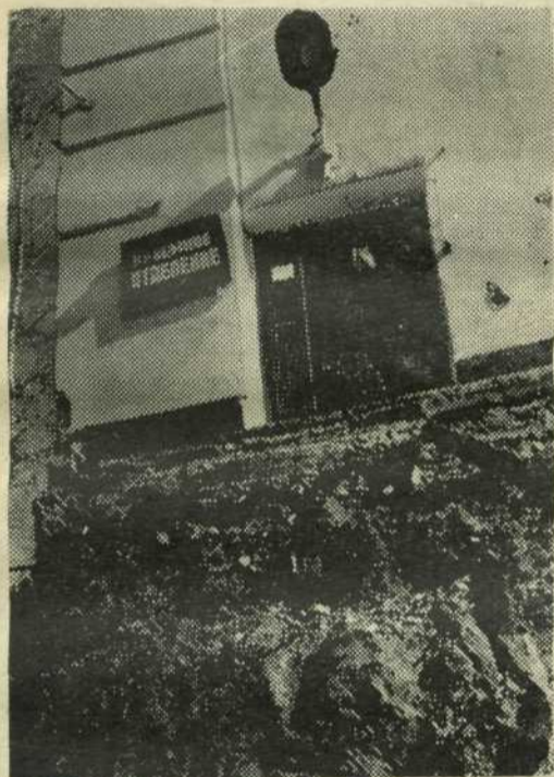
К приему больных готовы...

СЕГОДНЯ В БИРОБИДЖАН ПРИЕЗЖАЕТ ДЕЛЕГАЦИЯ АМЕРИКАНСКИХ ВРАЧЕЙ ИЗ ГОРОДА-ПОБРАТИМА БИВЕРТОНА. ДОБРО ПОЖАЛОВАТЬ!